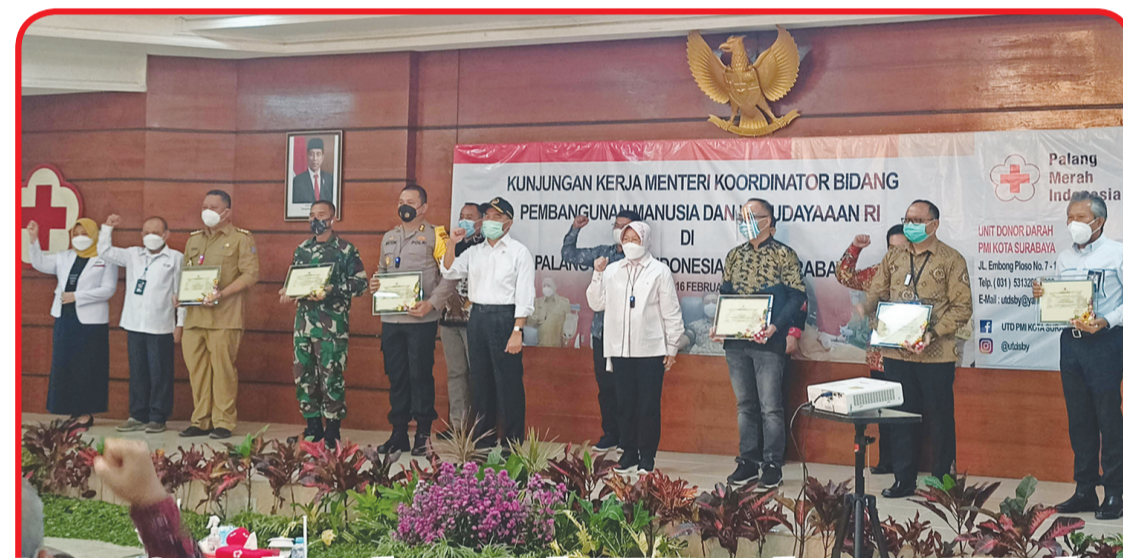
Para penerima penghargaan bersama Menko PMK, Mensos dan pengurus PMI Surabaya.