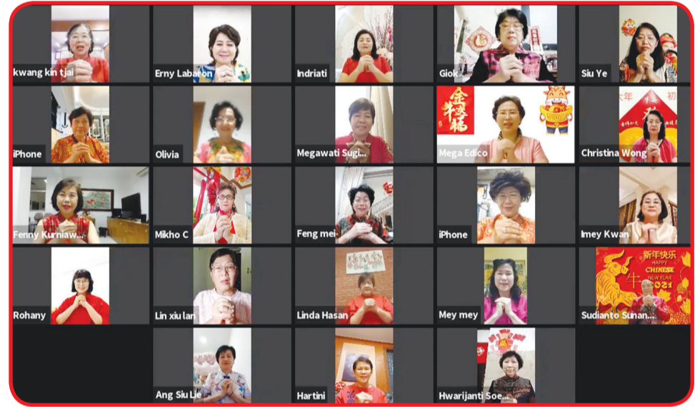
Anggota Dharma Wanita Hin An dan warga Yayasan Hin An Hwee Koan saling mengucapkan Selamat Tahun Baru Imlek secara online.