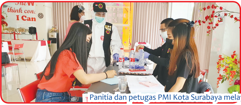
Panitia dan petugas PMI Kota Surabaya melayani warga yang ingin mendonorkan darahnya.