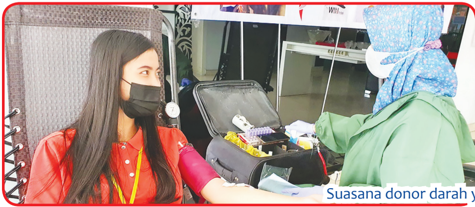
Suasana donor darah yang berlangsung lancar.

SURABAYA (IM) - Harmonis Karaoke Club bersama Hotel Win mengadakan Gerakan Donor Darah dan Donor Plasma Konvalesen, Minggu (14/2) di Hotel Win, Jalan Embong Tanjung, Surabaya. Donor darah diikuti oleh 20 pendonor dan 1 orang pendonor plasma konvalesen. Para pendonor oleh panitia penyelenggara diberikan paket sembako berisikan 2 kg beras, 2 kg gula pasir, 1 liter minyak goreng, 2 bungkus biscuit, 2 bungkus the, 1 kaleng susu, 1 botol sambal, 1 botol kecap dan