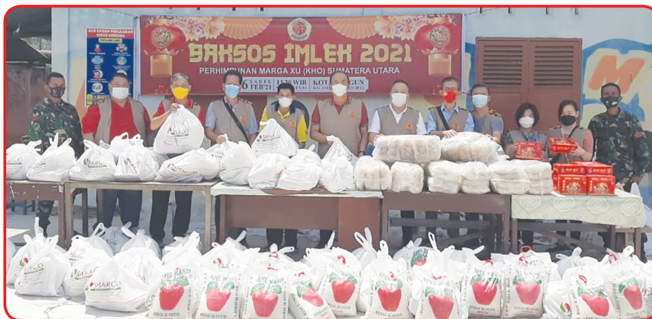
FOTO BERSAMA: Pengurus Perhimpunan Marga Xu Sumatera Utara berfoto bersama di lokasi baksos Imlek.

di Tahun Kerbau ini. Terakhir dirinya menyatakan terima kasih atas dukungan dan bantuan yang diberikan seluruh warga dan para donatur. Sehingga kegiatan baksos ini dapat berlangsung dengan lancar dan tepat waktu. • idn/din