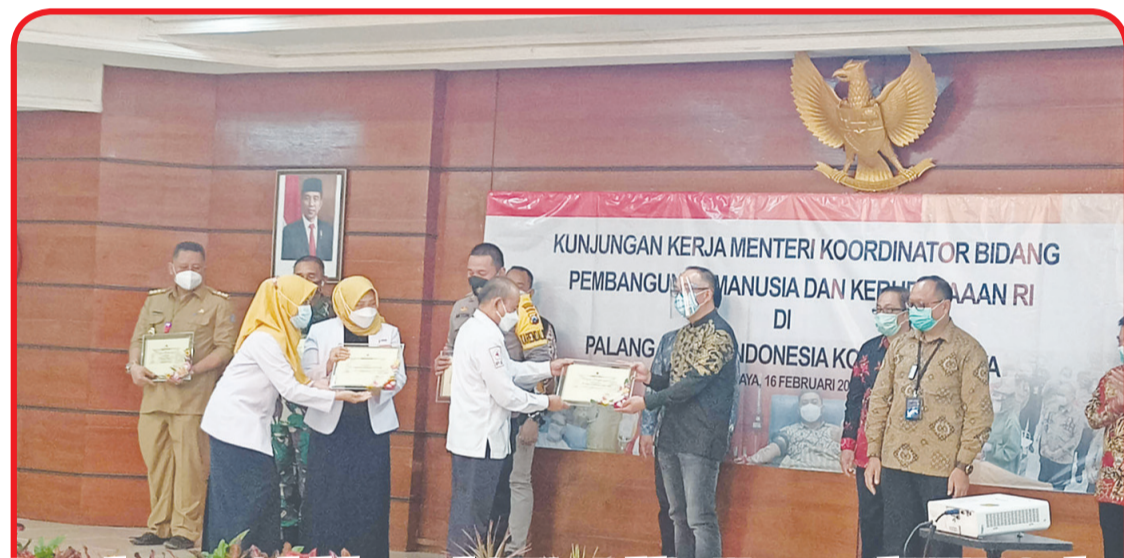
Penyerahan secara simbolis bantuan dari PT Sinar Indahjaya Kencana untuk PMI Kota Surabaya

Menko PMK Muhadjir Effendy mengakui setelah pencairan Gerakan Donor Plasma Konvalensan ada kenaikan 4 kali lipat perolehan plasma konvalensan, sehingga pasien yang antri mendapatkan plasma konva-